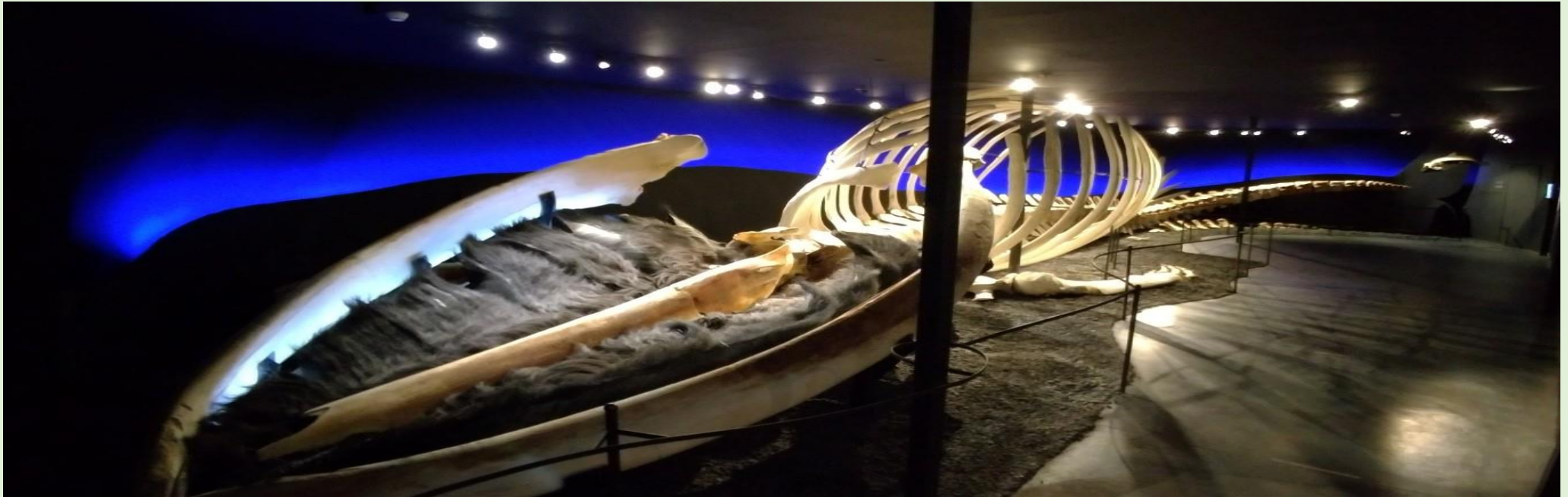
(Museu da Baleia, Husavik : esqueleto baleia azul (25 metros), o maior animal do planeta)